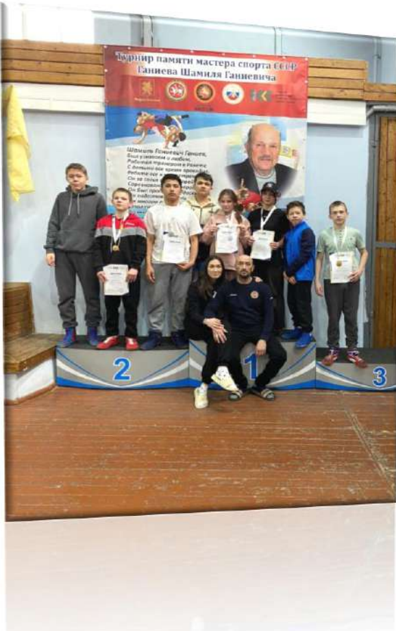
Республиканский турнир по вольной борьбе среди юношей и девушек до 14 лет, памяти мастера спорта СССР Ганиева Шамиля Ганиевича