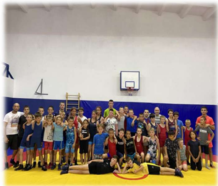
Поездка на учебно-тренировочный сбор по вольной борьбе в г. Геленджик